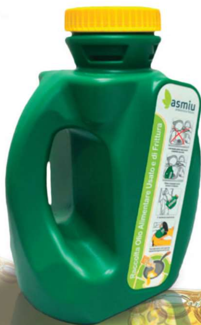
Tanica 3,5 lt (su richiesta)