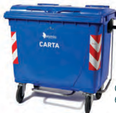
Cassonetto blu. 660 lt