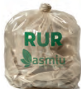
Sacco trasparente 145 lt Esporre ben chiuso