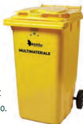
Bidone carrellato giallo 240 e 360 lt Esporre con coperchio chiuso