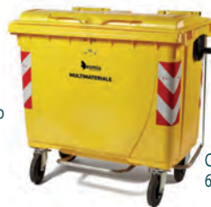
Cassonetto giallo 660 lt