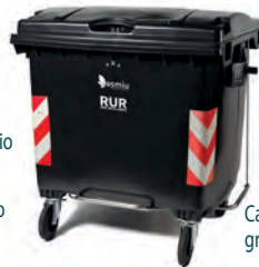
Cassonetto grigio 660 lt