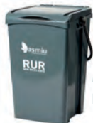
Mastello grigio 25 lt Esporre con coperchio chiuso