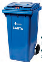
Bidone carrellato blu 120 e 240 lt Esporre con coperchio chiuso