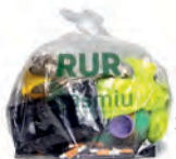
Sacchetto trasparente 45 lt