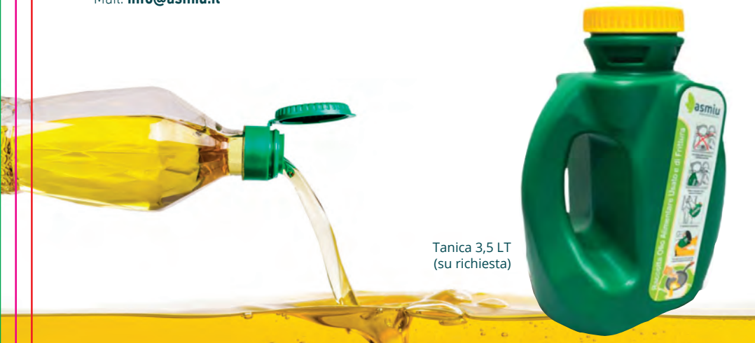
Tanica 3,5 LT (su richiesta)