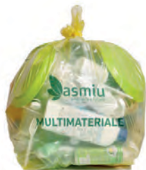
Sacco giallo 90 lt Esporre ben chiuso.