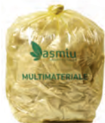
Sacco giallo 145 lt Esporre ben chiuso.