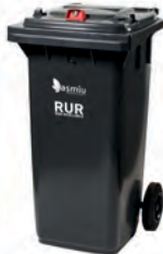
Bidone carrellato grigio 120 e 240 lt Esporre con coperchio chiuso